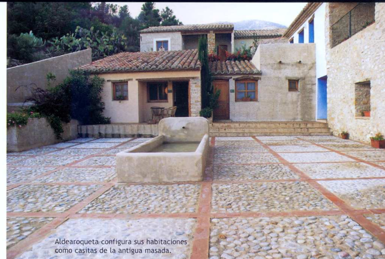
Aldearoqueta configura sus habitaciones como casitas de la antigua masada.

Eighteen rooms are available, all of which are adaptable to accommodate from two to four persons with additional cots for babies if required. The hamlet has been lovingly restored and though you may only be looking for simplicity no comfort has been overlooked. The fireplace, books, billiards, board games, woodland, biking, hillwalking: how long since we indulged in all these pleasures! At times it may seem strange there, almost like being lost in a world where dreams and memory fuse. Just sitting by the fountain in the square as night falls may send a shiver of pleasure down our